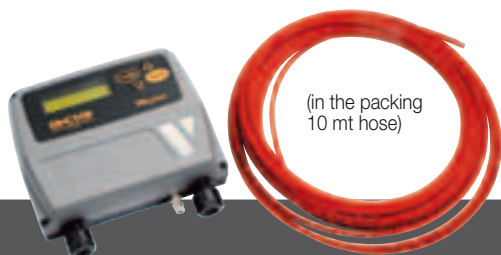
(in the packing 10 mt hose)