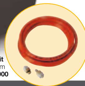
Oil Kit Hose length 3 mt Ø 12 mm Code: F12939000